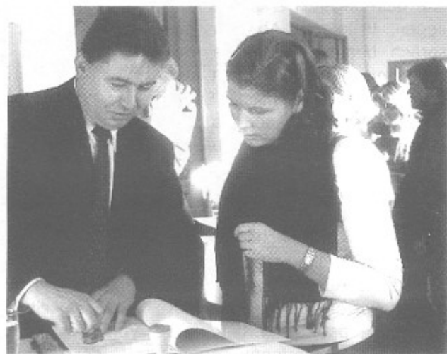
Vertreter der Handelskammer unterschreiben die Zertifizierung nach dem Berufsbildungsgesetz