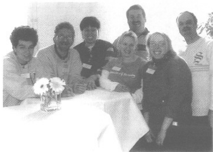
12 Zukünftige Teilnehmer des Projektes

Wir haben es geschafft: Die angestrebte Zertifizierung nach dem Berufsbildungsgesetz haben wir am 24.11. durch die Handelskammer Hamburg erhalten, die Unterrichtspläne und Unterrichtsmaterialien stehen, TeilnehmerInnen und Betriebe wurden gefunden, der Zuwendungsbescheid für unser 24-monatiges Modellprojekt ist unterschrieben und das Projekt hat sich bereits in der Vorlaufphase einen Namen gemacht: Aus allen Himmelsrichtungen erreichen uns interessierte Nachfragen. Dass dies alles in der doch recht kurzen Zeit geklappt hat, ist eine Gesamtleistung unseres 12er Teams mit seinen unterschiedlichen, sich ergänzenden Fähigkeiten und vollem Einsatz jedes Einzelnen.